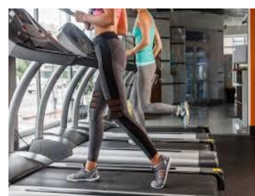
スポーツジム・ レジャー施設