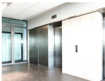
オフィス・工場 ・重要施設