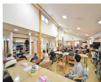
病院・福祉介護 施設