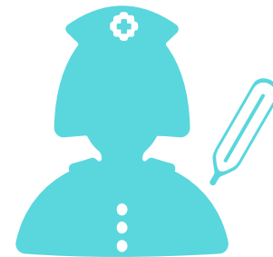
体温計での体温測定 (耳式体温計/ 水銀体温計)