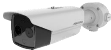
検温サーモカメラで 非接触温度測定