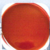
白癬菌 (ほくそむく)