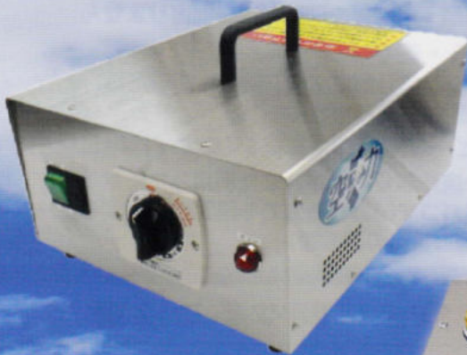
ハンディータイプ 【CS560CD】