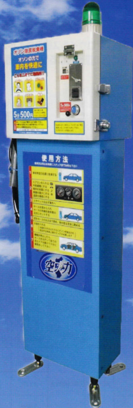
設置タイプ(コインタイマー式) 【CE705C】