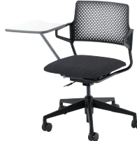
ブラックフレーム/ A4メモ台付