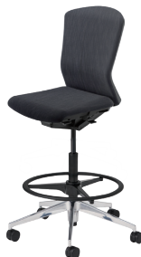
ハイシート/ハイバック