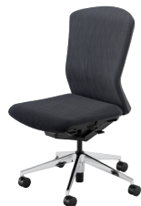
ポリッシュ脚/ハイバック