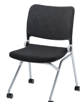
塗装脚/背パット付