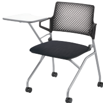
シルバーメタリック脚/ A4メモ台付