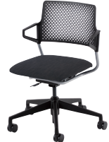
シルバーメタリックフレーム/ 肘付