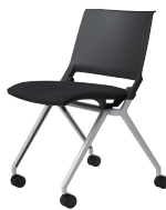
シルバーメタリック脚