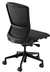
樹脂脚/ミドルバック